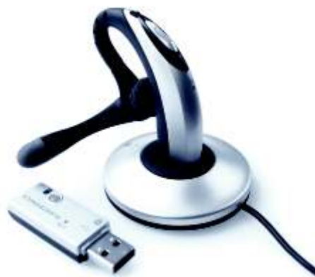
SwyxIt! Headset H390

Das Headset ist die optimale Lösung für Empfangsmitarbeiter oder Vieltelefonierer. Mit den USB-Headsets (Kopfhörer und Mikrofon) können Benutzer während eines Telefonats gleichzeitig den Computer bedienen. Die Headsets sind USB-kompatibel und können überall im Büro eingesetzt werden. Geringe Abmessungen und ein niedriges Gewicht machen sie zu einer idealen Lösung für mobile Mitarbeiter, die oft unterwegs sind, aber in unregelmäßigen Abständen auf das Unternehmensnetzwerk zugreifen müssen. Mit den schnurlosen Headsets können sich Benutzer von ihrem Arbeitsplatz entfernen und bleiben dennoch innerhalb ihrer Arbeitsumgebung erreichbar – eine wirklich mobile Lösung.