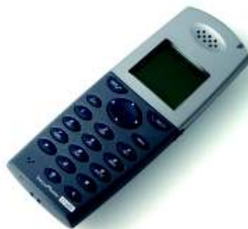
DECT Phone D300

Mit der schnurlosen Lösung von SwyxWare sind alle Ihre Mitarbeiter, auch diejenigen, die nicht direkt an ihrem Arbeitsplatz tätig sind, während der Arbeitszeit immer erreichbar. Mit der schnurlosen Voice-over-IP-Lösung IP DECT können auch Mitarbeiter, die sich in weitläufigen Lager- oder Produktionshallen aufhalten, in die SwyxWare-IP-Telefonanlage eingebunden werden.