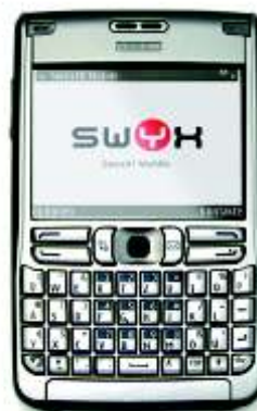
Swyxt! Mobile für Ihr Handy

Dank umfassender Features wie u. a. persönliches Adressbuch, Namenstasten, Anrufmitschnitt und Rufumleitung ist Swyxt! Now einer der leistungsfähigsten Telefonie-Clients für PCs auf dem Markt.