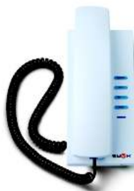
SwyxIt! USB Handset P250

Das Telefonieren mit dem SwyxIt! USB Handset ist einfach und komfortabel. Das Handset wird an den USB-Anschluss eines PCs oder Laptops angeschlossen und bietet vollen Hook on/off-Support, die Eingabe von Nummern kann über die PC-/Laptop-Tastatur erfolgen. Wichtige Telefoniefunktionen, wie Verbinden, Halten, Weiterleiten oder Konferenzen, können mühelos auf der Benutzeroberfläche des SwyxIt! Softphones ausgewählt werden, sodass die Umstellung von einem herkömmlichen Telefon auf ein USB-Handset einfach und komfortabel ist.