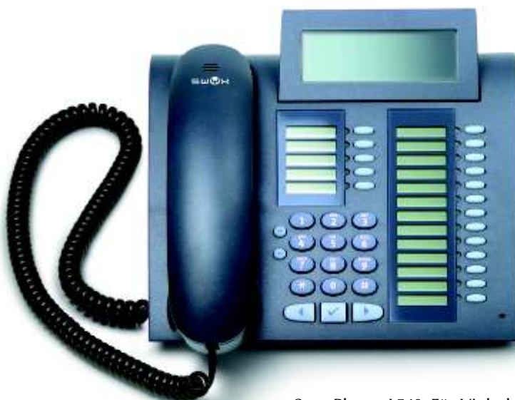
SwyxPhone L540: Für Vieltelefonierer, mit vierzeiligem Display (Beispielfarbe: Mangan)

Das neue SwyxPhone S315 ist eine kostengünstige Einstiegsvariante, um alle Vorteile der IP-Telefonie zu nutzen. Das SwyxPhone S315 verbindet klassisches Design und modernste Technik mit einem ausgezeichneten Preis/Leistungsverhältnis. Durch die Unterstützung standardisierter SIP-Protokolle ist das Telefon zudem zukunftssicher und kann sehr flexibel und universell in verschiedenste IT-Infrastrukturen integriert werden. Die Inbetriebnahme und Wartung des SwyxPhone S315 gestaltet sich sehr einfach: Ein Installationsassistent ermöglicht eine schnelle Inbetriebnahme des Telefons. Darüber hinaus lassen sich Telefonie- und Netzwerkfunktionen vom Administrator oder autorisierten Anwender auch bequem am PC über das Web-Interface des SwyxPhone S315 vornehmen, welches vom integrierten Web-Server bereitgestellt wird.